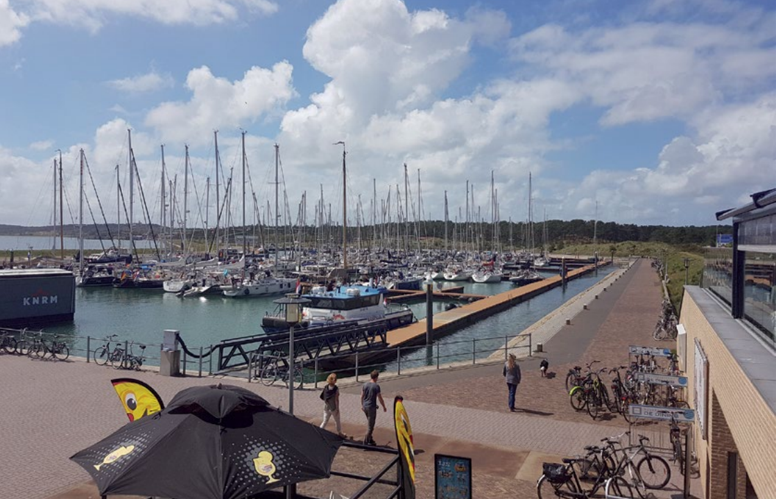
Gut ausgestattet, aber auch gut besucht: der Yachthafen von Vlieland