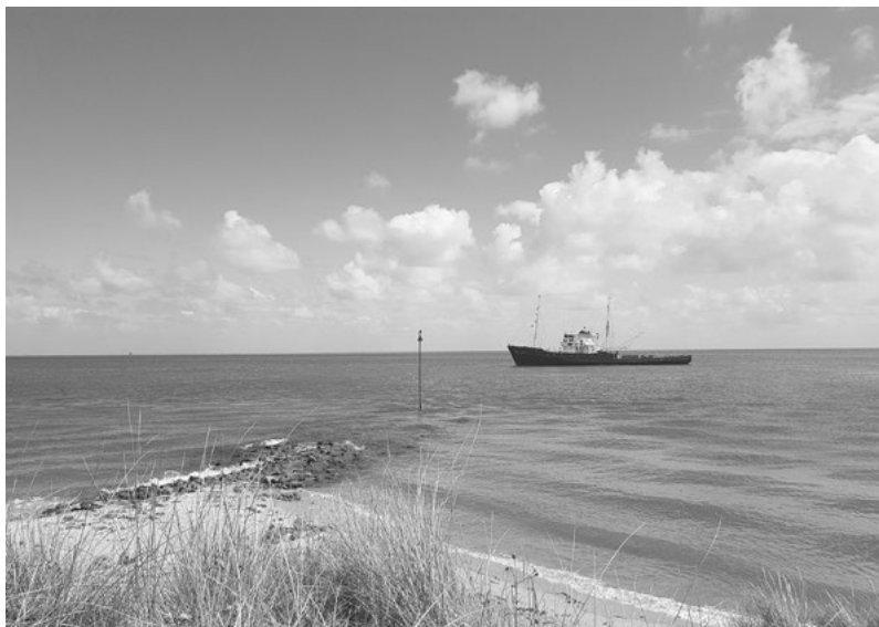
Blick von Vlieland auf das Fahrwasser Vliesloot

Es gibt die Möglichkeit, sich im Web über die Liegeplatz-Situation in den Yachthäfen auf den Inseln zu informieren. Unter www.waddenhavens.nl erhält man aktuelle Infos über die Auslastung der Yachthäfen. Man kann sich somit bequem schon bei der Routenplanung ein Bild machen und überlegen, ob man den jeweiligen Yachthafen anlaufen möchte oder auch kann.