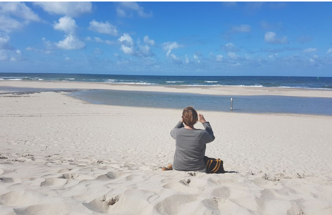
Auch in der Saison oft menschenleer: die weiten Sandstrände auf Vlieland