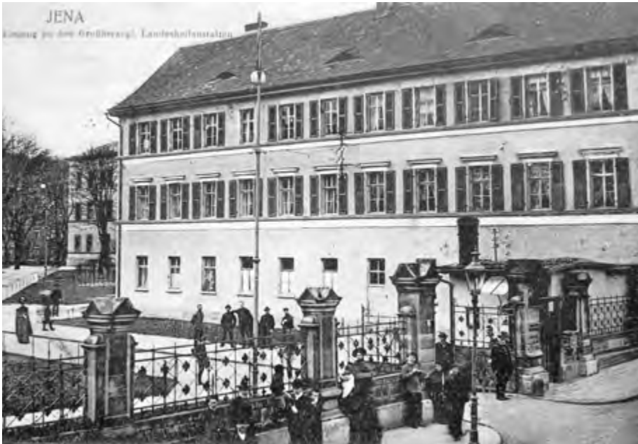
Bild 1-2: Foto vom Eingangsbereich der Jenaer Landeskrankenanstalten vor 1910 mit Blick auf die Medizinische Klinik