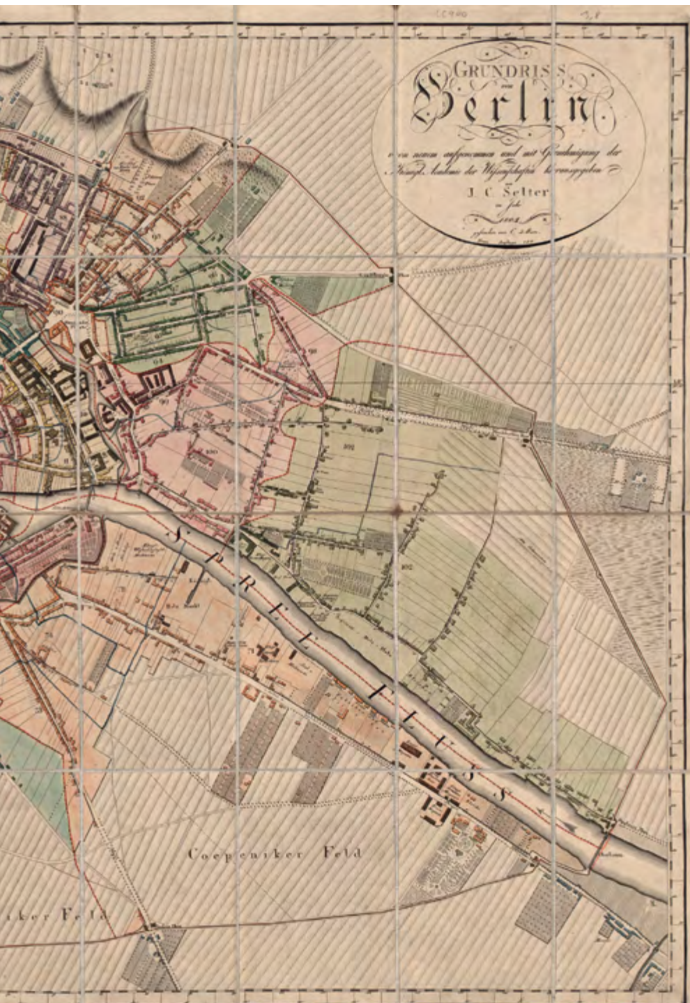
Bild 1-1: Stadtplan von Berlin aus dem Jahr 1811 mit dem Eckhaus Markgrafenstraße 74/Zimmerstraße 31 (roter Pfeil), dem Wohnhaus der Lüderitz-Familie 1820–1875