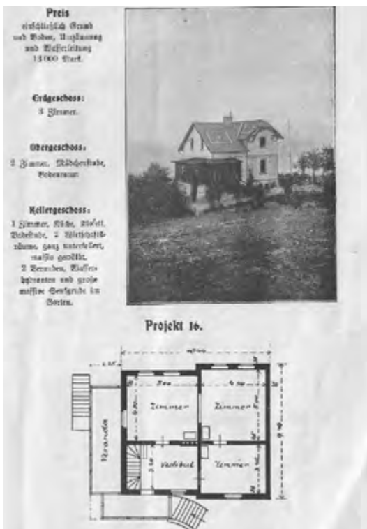
Muster des Hauses, das Carl Lüderitz in Waldsiedersdorf gekauft hatte (Quelle: 14 )

Mit diesem Polster dürfte er die mehr als 25 Jahre bis zu seinem Tod 1930 gut gelebt und wahrscheinlich auch die Zeit des Ersten Weltkriegs, die darauffolgende Versorgungskrise und die Weltwirtschaftskrise der späten 1920er Jahre gut überstanden haben.